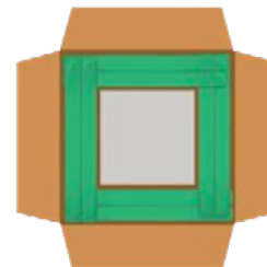
Protection des angles