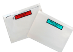
Pochette adhésive porte-document