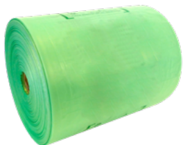
Film écologique pour machine AKA® AIR BIO