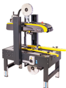
Fermeuse de caisse