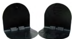
Coins parafeuillards plastique avec et sans picots