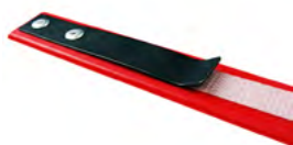
Aiguille pour passage feuillard sous palette