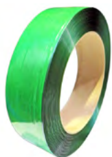
Feuillard PET Polyester