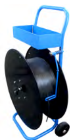
Dévidoir feuillard PET/PP