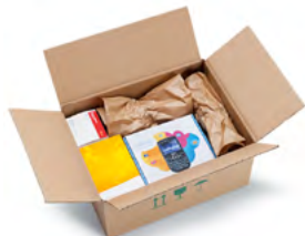
Papier de calage