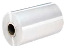
Film rétractable polyoléfine ou PVC