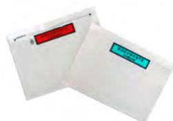
Pochette adhésive porte-document