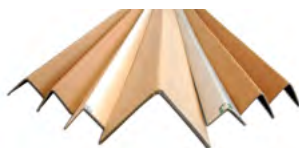
Cornièrre de protection