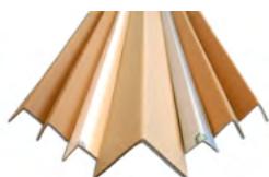
Cornière de protection